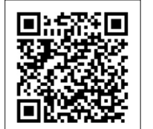
▲ 연회비 / 발전기금

후원금 납부 방법 모바일 폰에서 아래 QR코드 촬영 링크로 이동 후원하기 선택