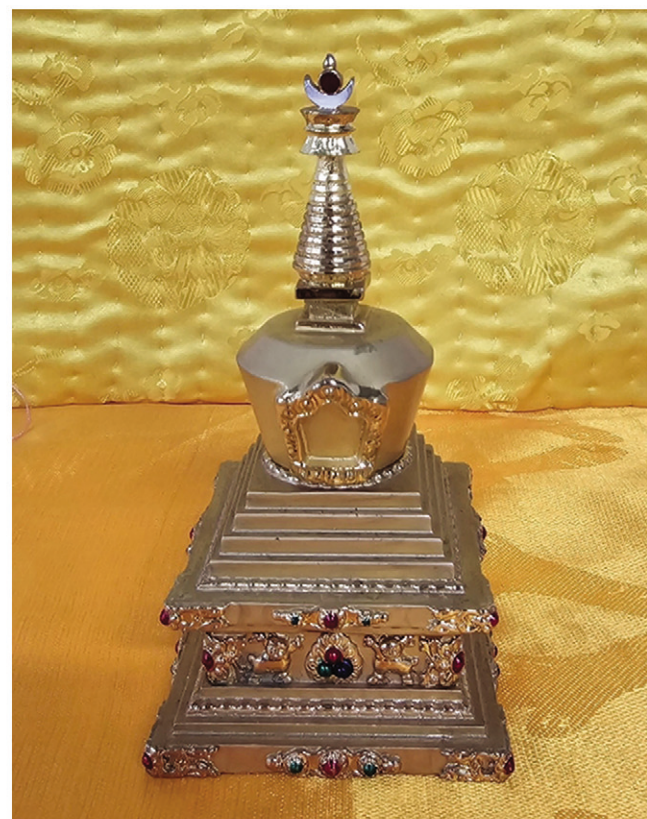
▲ 위 진신사리는 제14대 달라이라마 존자님께서 하사하신 사리입니다.