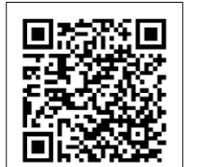
▲ 동국장학회 장학금