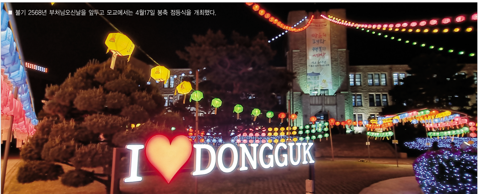
■ 불기 2568년 부처님오신날을 앞두고 모교에서는 4월17일 봉축 점등식을 개최했다.