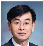
공명대 (화학) 前 동국대 교무부총장 1,000,000